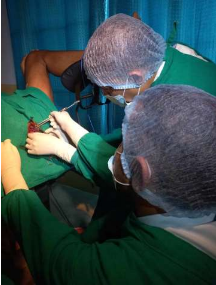
क्षारशुत्र सेवा @ धौलागिरी आयुर्वेद औषधालय, बाग्लुङ्ग

अंक २०२, वर्ष ६, २०८१ श्रावण ६, July 21, 2024 आइतबार