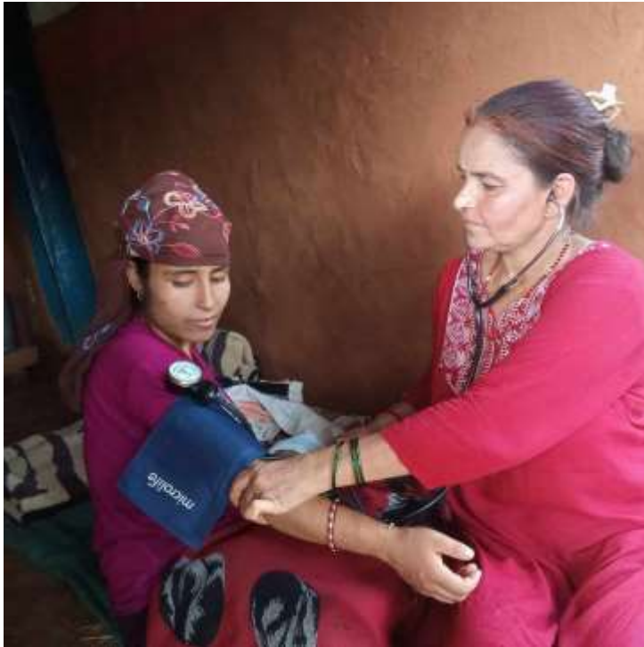
आधारभूत स्वास्थ्य सेवाकेन्द्र खर्बाङ्ग @ उत्तर प्रशुती सेवा

अंक २०२, वर्ष ६, २०८१ श्रावण ६, July 21, 2024 आइतबार