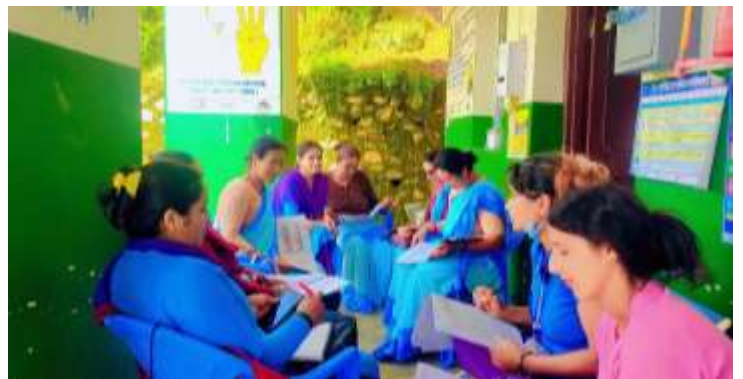
मासिक बैठक @ दगातुन्डाडा स्वास्थ्य चौकी, बागलुङ्ग

कुर्घा स्वास्थ्य चौकी, फलेवास नगरपालिका-१०, पर्वतले आ.व २०८१/८२ को वार्षिक कार्यतालिका सार्वजनिक गरेको छ।