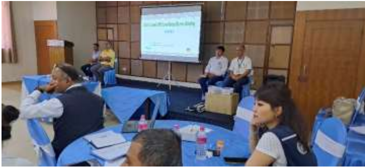
जिल्ला स्तरीय VPD surveillance कार्यशाला गोष्ठी@ कास्की