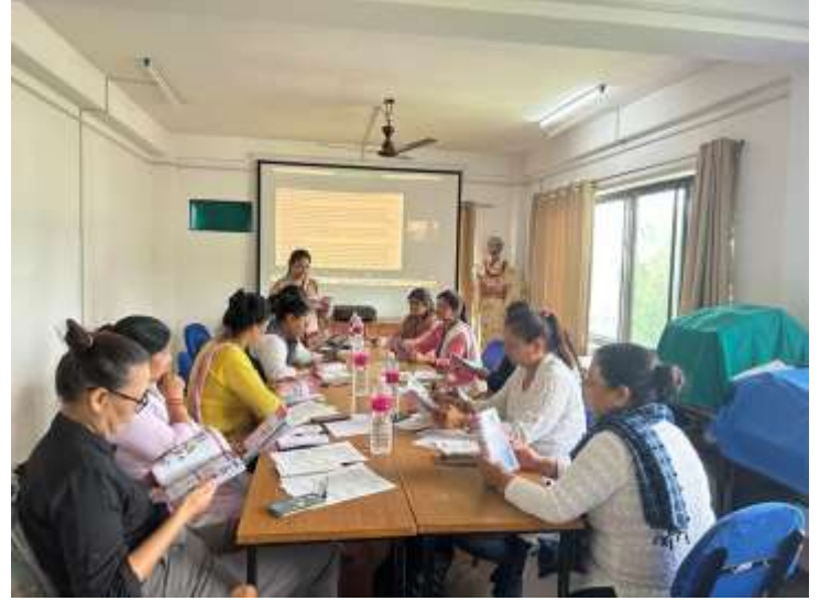
MCH-HB (Maternal and Child Health Handbook) workshop @ Kaski